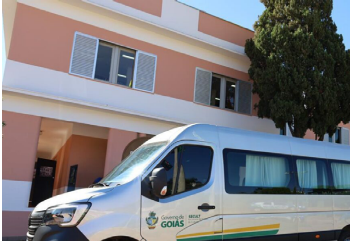
Até o momento, o Governo de Goiás já percorreu 12, de um total de 24 municípios que serão visitados com a atividade

A secretária de Estado da Cultura, Yara Nunes, ressalta os benefícios dessa ação que tem reunido gestores da SECULT Goiás e trabalhadores de todas as regiões de Goiás para um momento de diálogo. "É um momento de conversa, tira dúvidas e também de integração