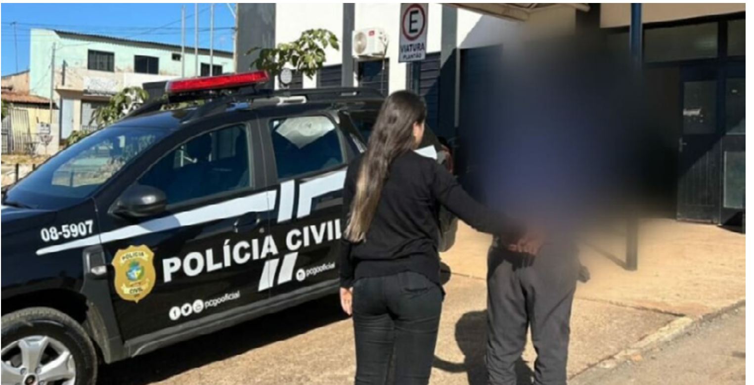
A ação foi conduzida pela equipe de policiais civis da 1ª Delegacia Distrital de Polícia de Águas Lindas

O condenado, cuja identidade não foi divulgada, possui um histórico criminal extenso. Os crimes pelos quais foi condenado envol-