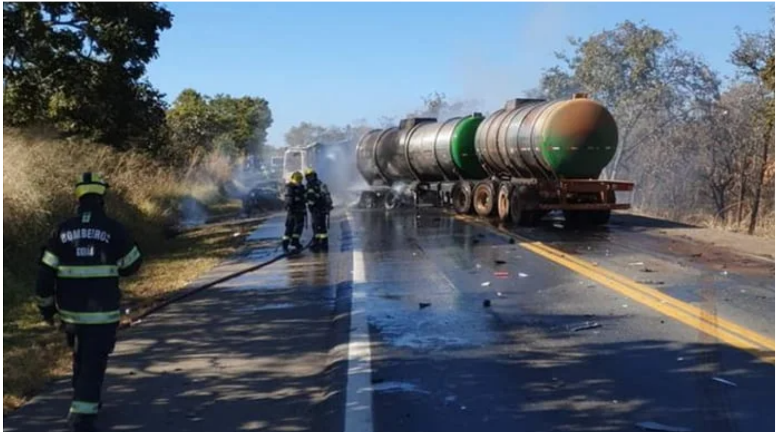
Imagens gravadas por testemunhas que circulam na internet mostram os veículos em chamas

Relatos do Corpo de Bombeiros detalham que o motorista do caminhão afirmou que o carro de passeio tentou ultrapassá-lo, mas acabou colidindo com a lateral do tanque. O acidente ocorreu na direção de Cristalina. Imagens gravadas por testemunhas que circulam na internet mostram os veículos em chamas e o trânsito