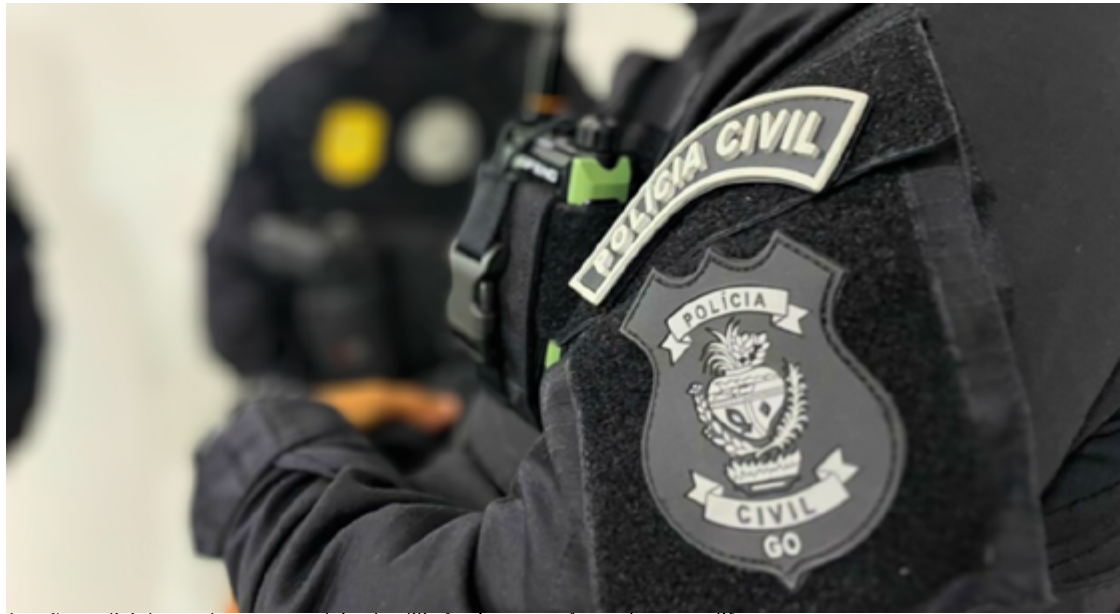
A ação policial envolveu uma série de diligências em três endereços diferentes

empresa responsável pelo fornecimento de energia na região, participaram ativamente da operação, fornecendo suporte técnico e relatórios detalhados sobre os desvios