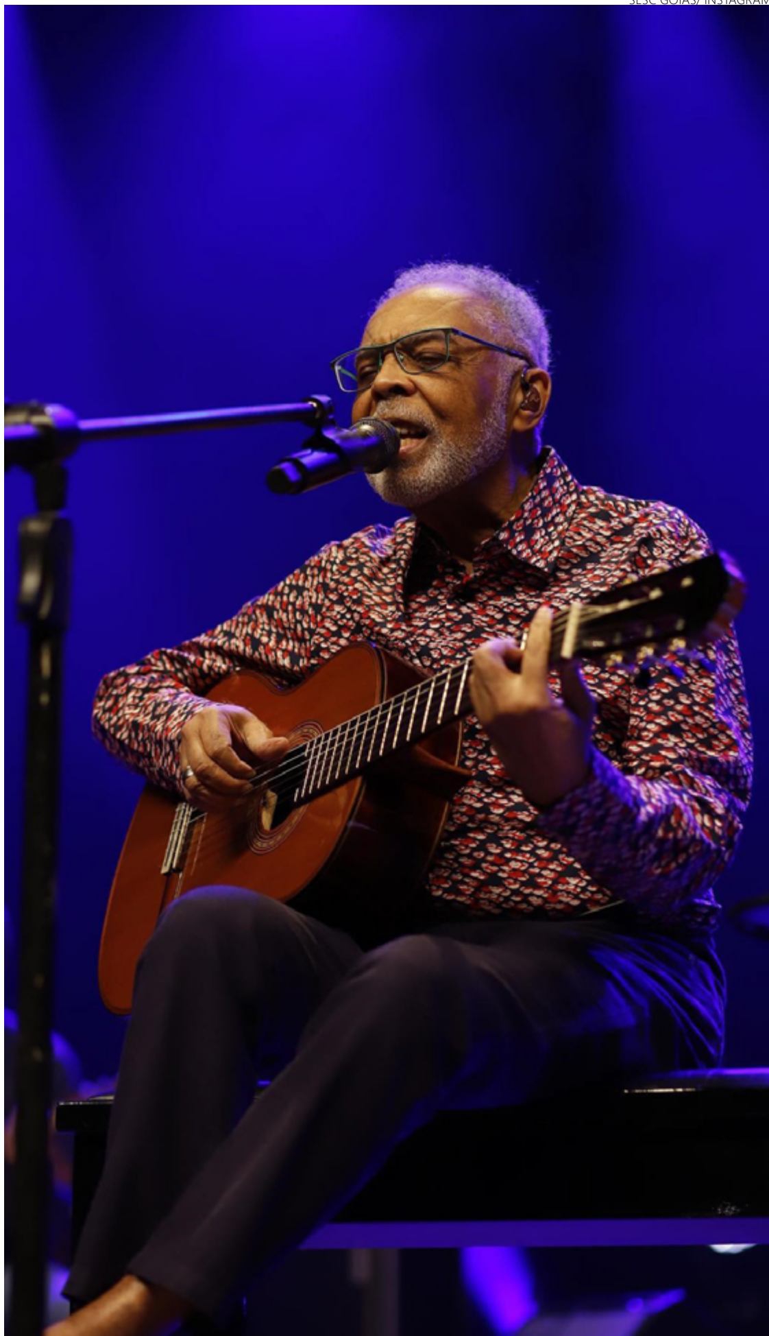
Gilberto Gil fez show apoteótico para convidados em Goiânia

Fomos ao delírio. Houve espaço, todavia, para composição escrita naqueles tempos amordaçados do exílio. Tão logo tocara a introdução de "Ladeira da Preguiça", conhecida no vzeirão cortante de Elis Regina, o público estrilou. A fase londrina deu no elepê "Expresso 2222", de 71, que demonstra Gil numa sintonia contracultural com linguagem dos Stones.