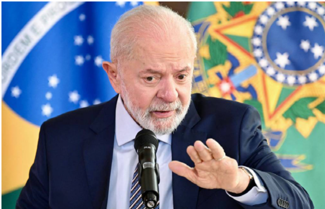
Lula da Silva: preocupação com declarações do presidente Nicolás Maduro

“Espero que seja isso que aconteça, pelo bem da Venezuela e pelo bem da Amé-