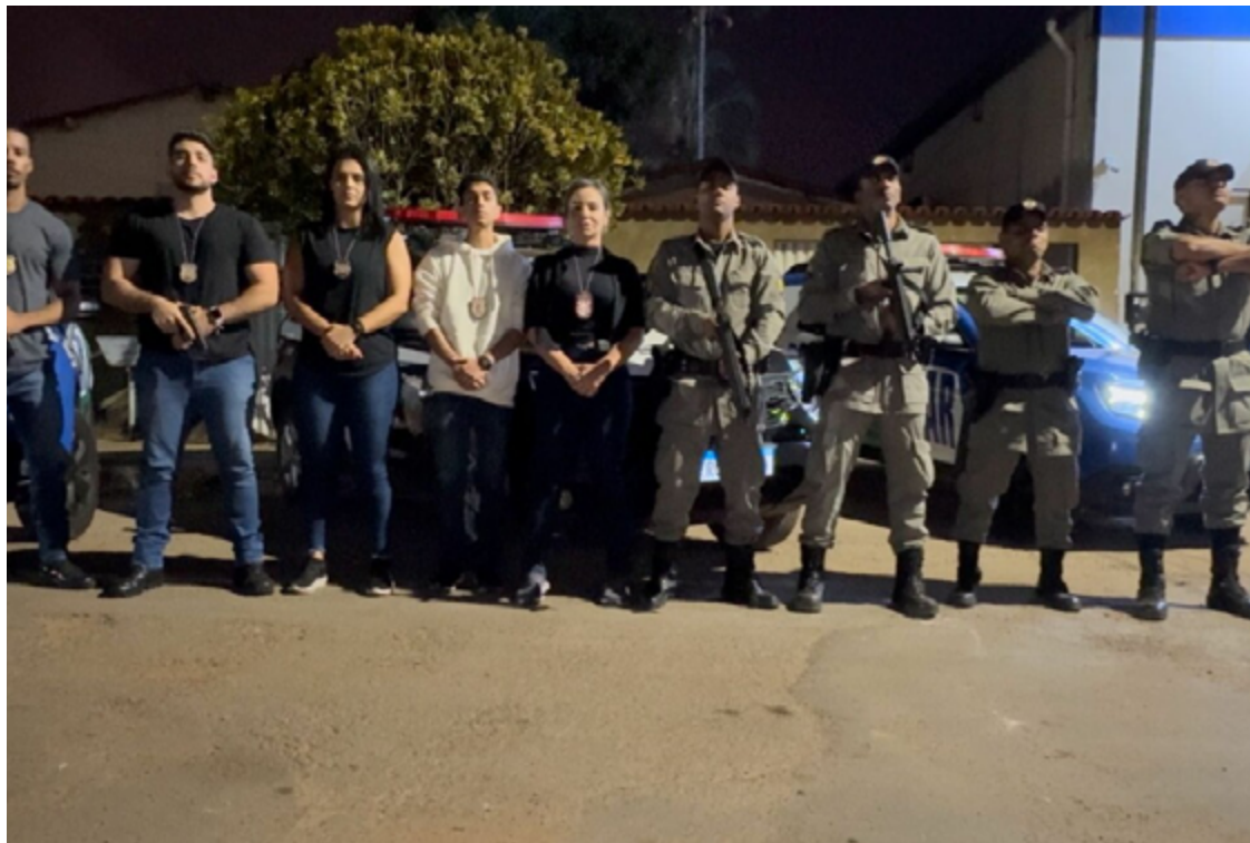
A operação contou com o apoio da Polícia Militar, que colaborou na execução dos mandados de prisão preventiva

A quadrilha é acusada de comandar um ponto de venda de drogas localizado estrategicamente em frente ao presídio da cidade. Segundo as investigações, a organização é responsável pelo arrombamento de três órgãos públicos municipais: a prefeitura, um colégio municipal e a Secretaria de Educação. Os objetos roubados eram trocados por armas e drogas com outros traficantes, revelando uma rede de troca e distribuição ilícita que ali-