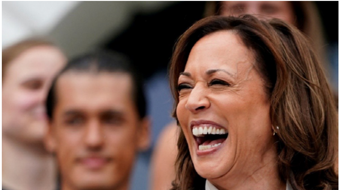
Harris personifica a diversidade e a mudança que ressoam com eleitores mais jovens e diversos

Além disso, a administração tomou ações agressivas contra as mudanças climáticas, confirmou um número histórico de juízes federais diversos e protegeu a igualdade no casamento para casais LGBTQI+ e inter-raciais. Essas conquistas posicionaram Harris como uma forte candi-