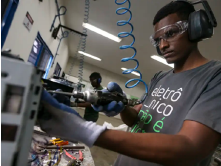
Ministros lançam documento na Reunião de Desenvolvimento